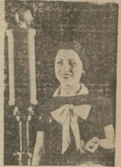
Ankara radyosunun kadın okuyucusu - rından biri mikrofon başında

«Sabah nesriyatında alafanga müziğe yer vermek lâzımsa, hafif parçalar seçmek daha doğru olur. Öğle nesriyatında plâk yerine